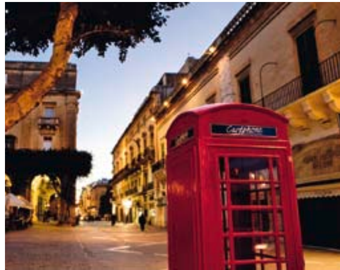
Wer hats erfunden? Die Malteser warrens nicht. Die Telefonkabine ist ein Erbe der britischen Kolonialherren.

Maltas Geschichte ist geprägt von auswärtigen Einflüssen. Das gilt auch für das Klettern. Die Inseln waren von 1800 bis 1964 eine englische Kolonie, und so waren die ersten, die hier die Felsen um des Kletterns Willen hochstiegen, englische Soldaten. Sie kannten nichts anderes als Clean Climbing. Seither besuchten auch andere Kletterer die Inseln. Besonders deutliche Spuren hinterliess Ende der 90er-Jahre eine italienische Truppe. Sie bohrte gleich eine ganze Felswand ein. Die «Locals» reagierten empört. Statt die Haken zu entfernen, forderten sie die italienischen Gäste aber auf, zumindest rostfreies Material zu verwenden, denn alles andere korrodiert in der Meeresluft. Heute kann man auf Maltas Inseln bereits eine Woche durchklettern, ohne je einen Keil legen zu müssen.