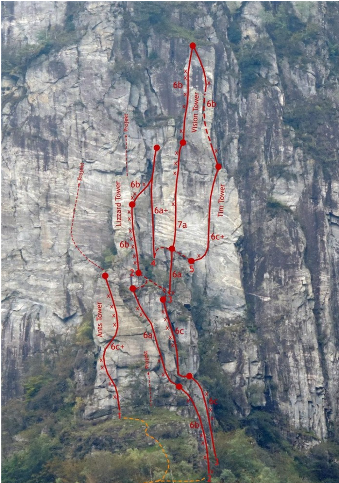
Sasso Trolcia