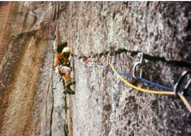
Claude Remy in La Darbellay (8a) 1972, damals entdeckt der Autor den Einstieg zu Etat de Choc .