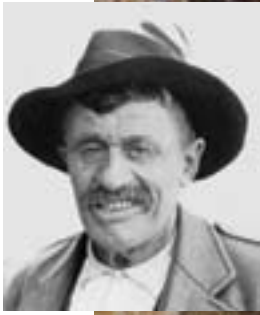
Die Bergführerlegende Maurice Cretetz (1872–1948).