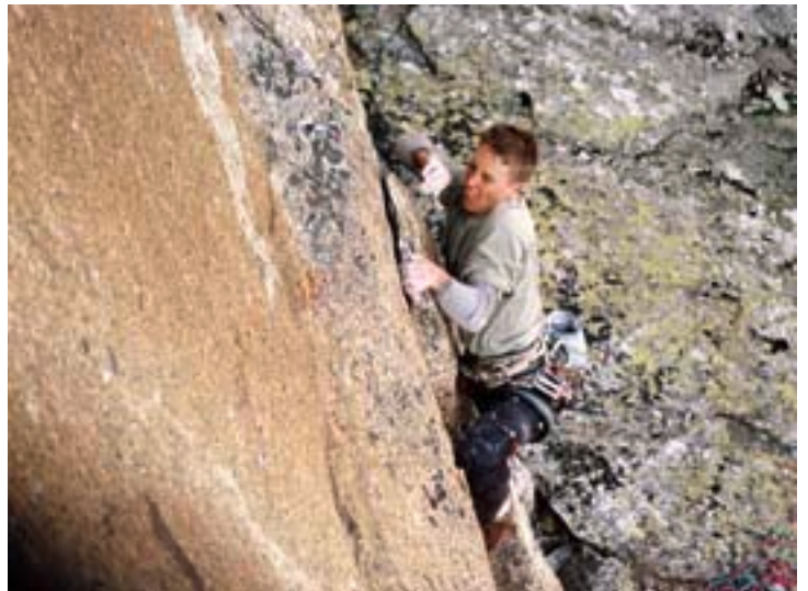
Simon Anthamatten war von der Darbellay fasziniert.

einem einzigen Ziel geprägten Winterbegehungen: Überleben. Die zwei erreichen den Gipfel in einem heftigen Sturm. Der Abstieg über den Westgrat vollzieht sich bei fürchterlichen Bedingungen, doch das Glück steht ihnen bei. Die Seilschaft findet schliesslich nicht ohne Mühe ihre Ski und fährt nach Praz de Fort ab.