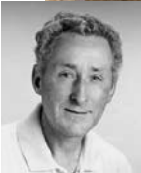
Léon Weissbaum