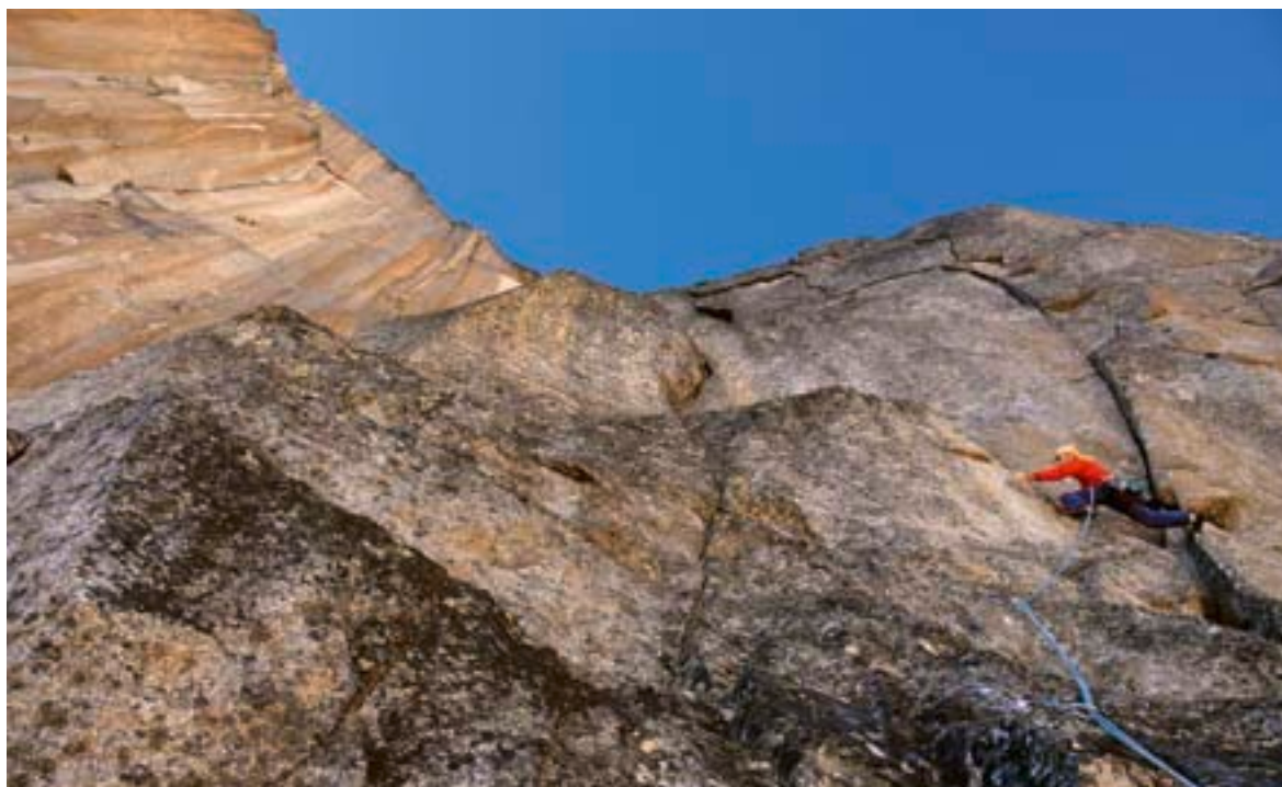
Plaisir immédiat (6c, 6a+ obl.), die Route im Risskamin der Nordwand ist gut zugänglich.