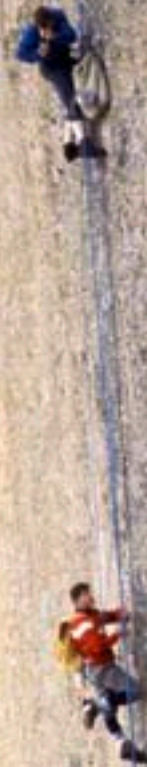
Michel Darbellay und Michel Vaucher etwa 1970 bei Filmarbeiten am Petit Clocher.