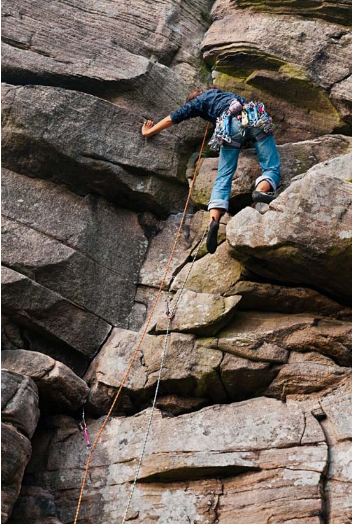
Mississippi Buttress Direct, VS 4c (Very Severe) im Sektor «Popular» von Stange. Die Route aus dem Jahr 1929 gilt als eine «of Stange's best» im einfacheren Segment.