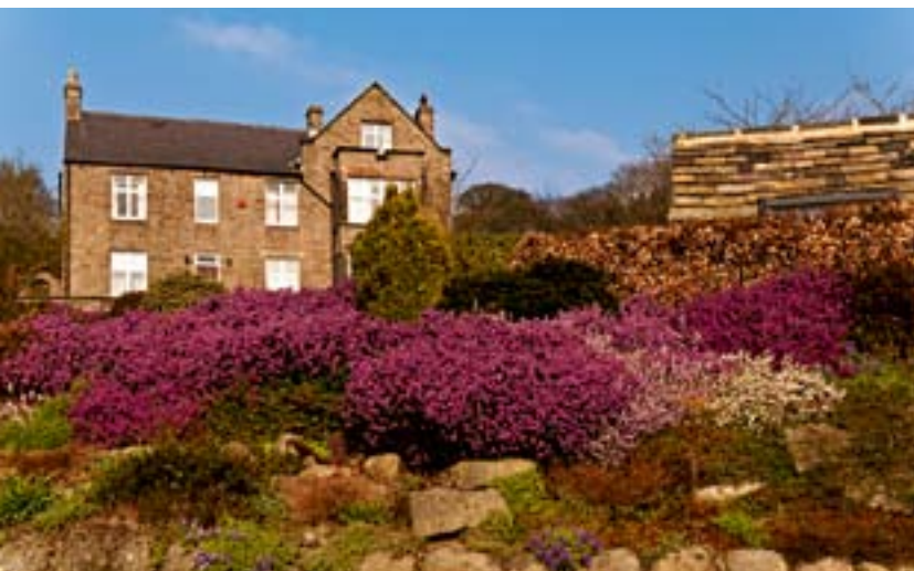
Blühende Erikasträucher in einem Vorgarten eines der typischen Steinhäuser in Hathersage.

Allein, die Wildnis hier ist zahm. Denn der Weg zurück in den Ort Hathersage ist nicht sehr weit. Sind die Arme müde, die Hände klamm oder die Wolken zu dunkel, sind Friends und Keile schnell im Rucksack verstaut und das Dorf Hathersage rasch wieder erreicht. Ein Dorf, wo in den Vorgärten der Backsteinhäuser Narzissen blühen, Jim im Pub den ganzen Tag Fish and Chips serviert und dunkles Bier zapft. Derweil Kletterer an Regentagen nebenan im «Coleman's Deli» einen Latte macchiato schlürfen und Blueberry-Muffins essen. Über Gritstone reden und im immer gleichen Buch blättern: Stanage – The Definitive Guide .