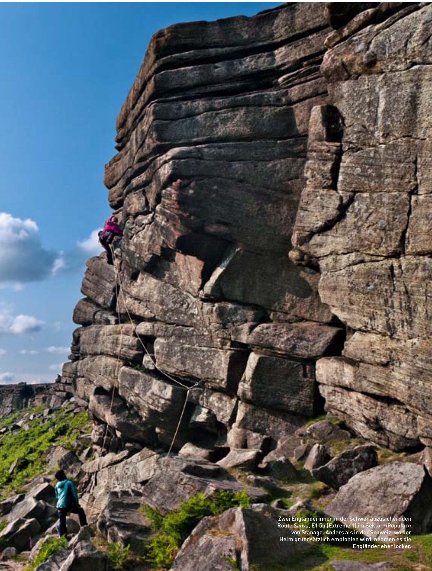
Zwei Engländerinnen in der schwer abzusichernden Route Saliva , E1 5b (Extreme 1) im Sektor «Popular» von Stanage. Anders als in der Schweiz, wo der Helm grundsätzlich empfohlen wird, nehmen es die Engländer eher locker.