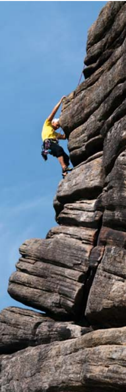
Ein Nachsteiger älteren Semesters in Saliva , E1 5b im Sektor «Popular».