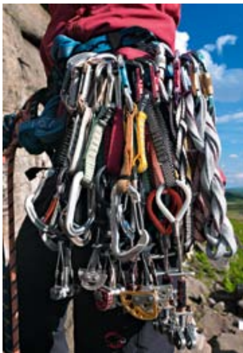
Ohne Friends und Keile lässt sich im Gritstone nicht klettern.

Ihre gute Stimmung lassen sich die Briten auch vom Wetter nicht verderben. «Hey mate, it will soon be snowing up here!» – da oben fängt es gleich an zu schneien – ruft einer vom oberen Felsrand hinab, während er seinen Kollegen nachsichert. Gut gelaunt tönt das, obwohl erste Regentropfen auf den Fels klatschen und der Nachsteiger in der Schlüsselstelle hängt. Britischer Humor macht auch vor dem Fels nicht halt. Was mancher Routenname zeigt: Shock Horror Slab oder Kelly's Eliminate sind nur zwei Beispiele dafür in Stanage, und die Route mit dem Namen Helfenstein's