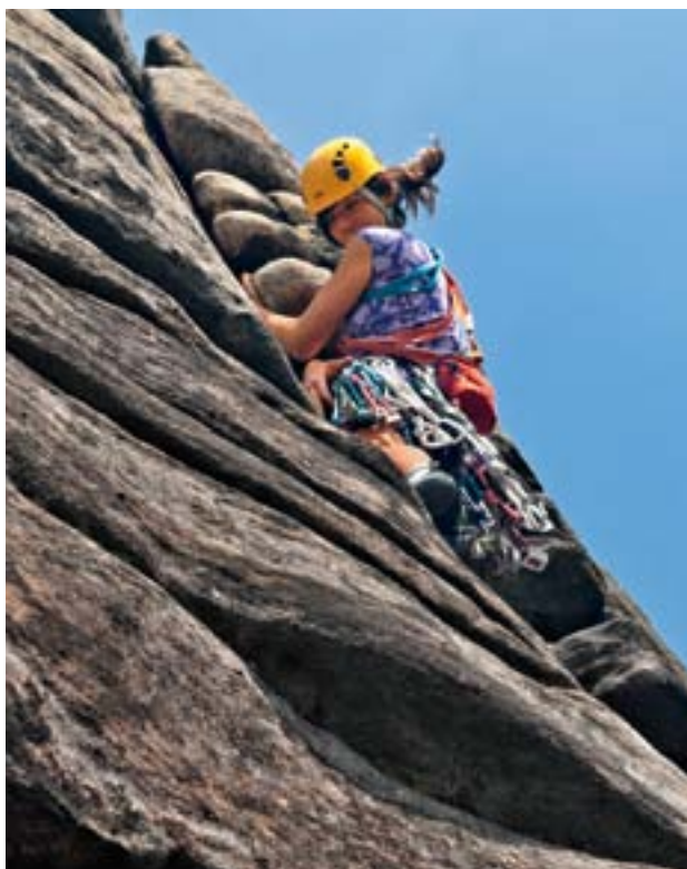
Eine Kletterin in der einfachen, aber «himmlisch» schönen Route Heaven Crack , VDiff (Very Difficult). Sie ist ideal, um sich im Selbersichern zu üben.