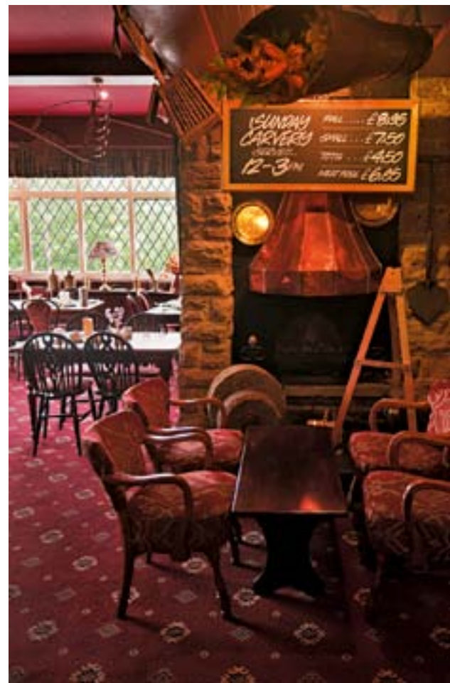
Gemütliches Pub des Millstone Inn am Dorfrand von Hathersage. Die Spezialitäten? Fish'n'Chips, dunkles Bier und Yorkshire Pudding.